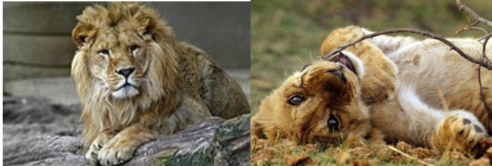
Le petit du lion est le lionceau .

Une crinière de longue fourrure autour de sa tête , une puissance hors du commun, un rugissement pouvant s'entendre jusqu'à 5 km... Le Lion porte bien son surnom de Roi de la Savane.